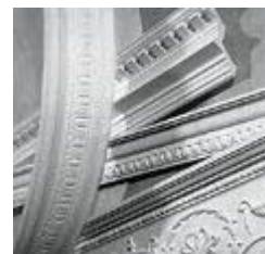
Все карнизы и панели молдингов могут быть изготовлены в гибком виде.