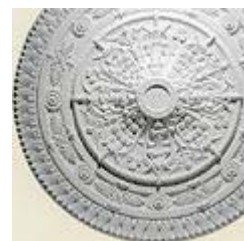
Потолочная розетка с диаметром 965 мм. Модель R 25 фирмы NMC.