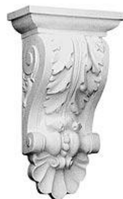
Кронштейны из полиуретановой лепнины из коллекции фирмы ORAC DECOR. В архитектуре жилища они служат опорной конструкцией для крепления сооружений к стене или колонне.