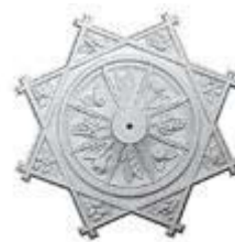
Потолочная розетка в форме восьмиконечной звезды фирмы BALLEDECOR.

Высокотехнологичное производство позволяет добиться четкого рельефа и точных размеров, что исключает технологическую подгонку деталей в процессе монтажа и гарантирует четкость рельефа даже после многократного окрашивания. Установка изделий из пенополиуретана отличается быстротой, чистотой и легкостью, особенно в сравнении с установкой аналогичных изделий из гипса, дерева и бетона. Лепниной из полистирола