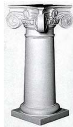
Полиуретановые статуи из коллекции фирмы GAUDI DECOR имеют классический и исторический дизайн.