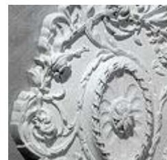
Модели потолочных розеток являются точным воспроизведением старинных образцов.