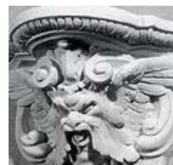
Элемент стенового декора из коллекции фирмы BALLEDECOR.