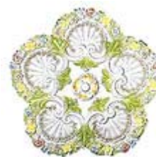
Потолочная розетка с диаметром 650 мм. Модель R 340C фирмы GAUDI DECOR.