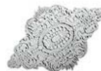
Потолочная розетка. Модель R 536 фирмы BALLEDECOR.