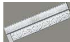
Лепные молдинги фирмы ORAC DECOR имеют множество вариантов применений. Их используют для украшения потолков и отделки мебели, а также в качестве рам для зеркал и картин.