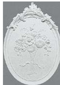
Элемент стенного декора фирмы ORAC DECOR.