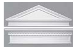
Сандрики фирмы ORAC DECOR. Простые в установке они придают элегантный вид любому дверному или оконному проему.