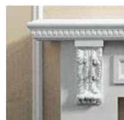
Торжество загородного архитектурного декора. Кронштейн из коллекции фирмы ORAC DECOR.