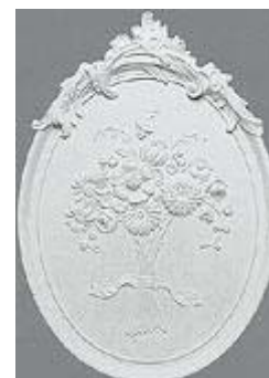
Элемент стенного декора фирмы ORAC DECOR.