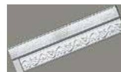
Лепные молдинги фирмы ORAC DECOR имеют множество вариантов применений. Их используют для украшения потолков и отделки мебели, а также в качестве рам для зеркал и картин.